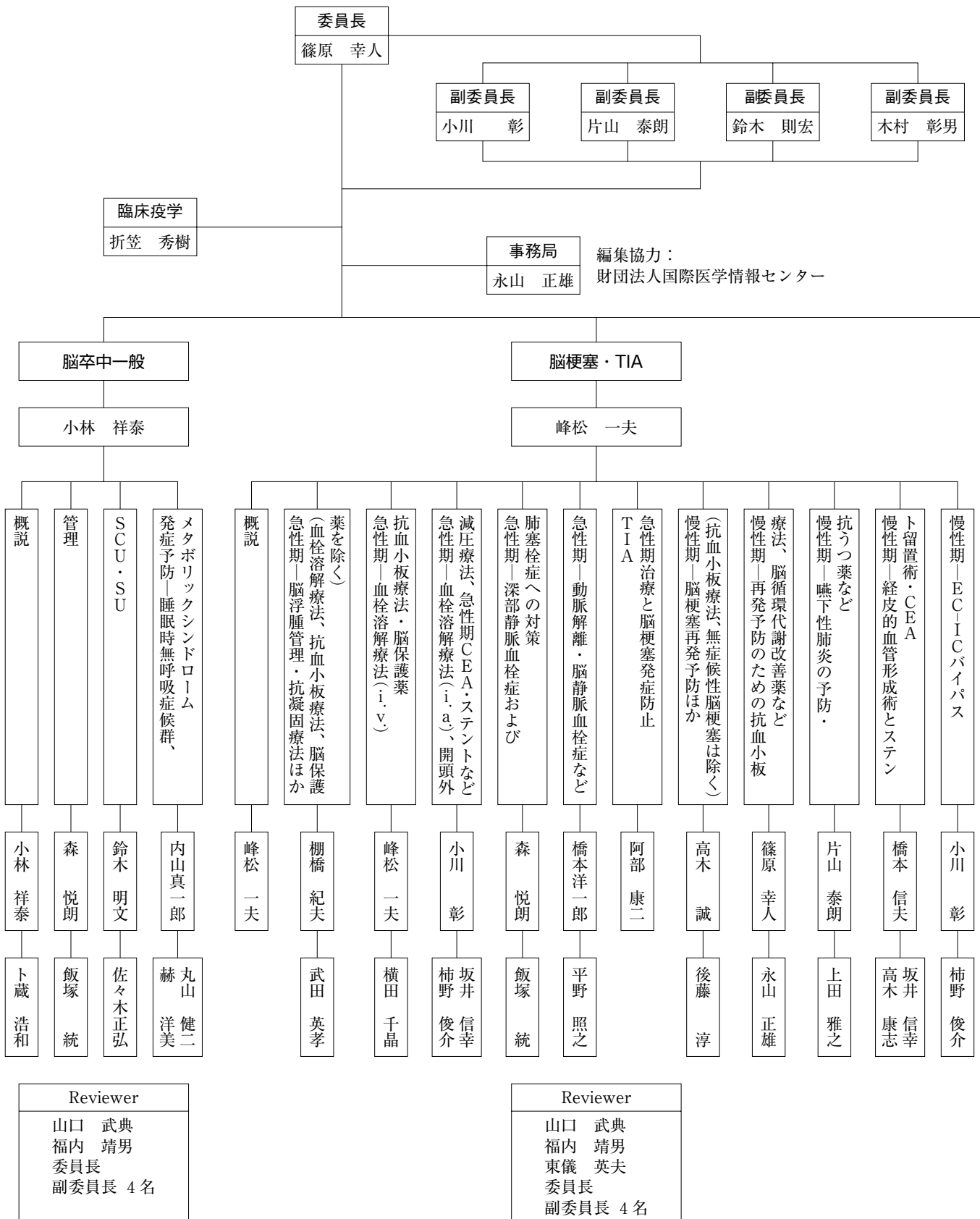
図3 脳卒中合同ガイドライン委員会の組織図